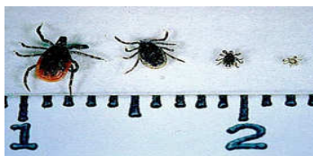
De gauche à droite : la tique adulte femelle, adulte mâle, nymphe et larve à l'échelle de 1 cm

Toutes les I. scapularis ne sont toutefois pas infestées par B. burgdorferi ; le taux d'infestation varie d'une région à l'autre et peut atteindre 60 % dans les zones les plus endémiques, notamment dans certains états de la côte est américaine.