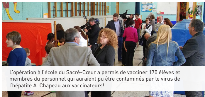
L'opération à l'école du Sacré-Cœur a permis de vacciner 170 élèves et membres du personnel qui auraient pu être contaminés par le virus de l'hépatite A. Chapeau aux vaccinateurs!

Quatre directions ont travaillé de concert, entre autres avec la commission scolaire, afin d'organiser ce marathon en un temps record: DSG, DProgrJeun, DSPub et la DRHCAJ, et ce, dans chacun des neuf RLS. Notons que moins de 24 heures ont séparé le signalement à la Santé publique et le début de la vaccination à l'école. MERCI À TOUS!