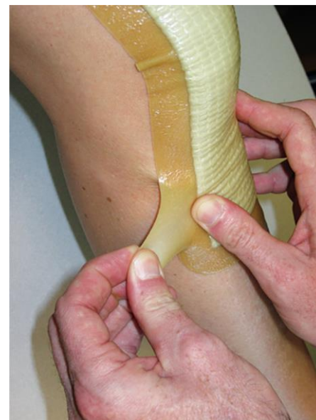
Ce pansement est beige sans alvéoles (il est « plein »).

Des questions ou des doutes? Téléphonnez au 811 (Info-Santé, 24h/24 7j/7) ou appelez l'infirmière de votre CLSC.