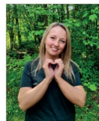
Photo de Christophe Duret | Journal communautaire d'Ascot Corner Aux quatre coins

En juillet dernier, une famille d'accueil du Haut-Saint-François a pris la parole dans le journal communautaire d'Ascot Corner. Stéphanie y a partagé son expérience ainsi que les qualités qu'elle considère importantes pour être famille d'accueil en Estrie.