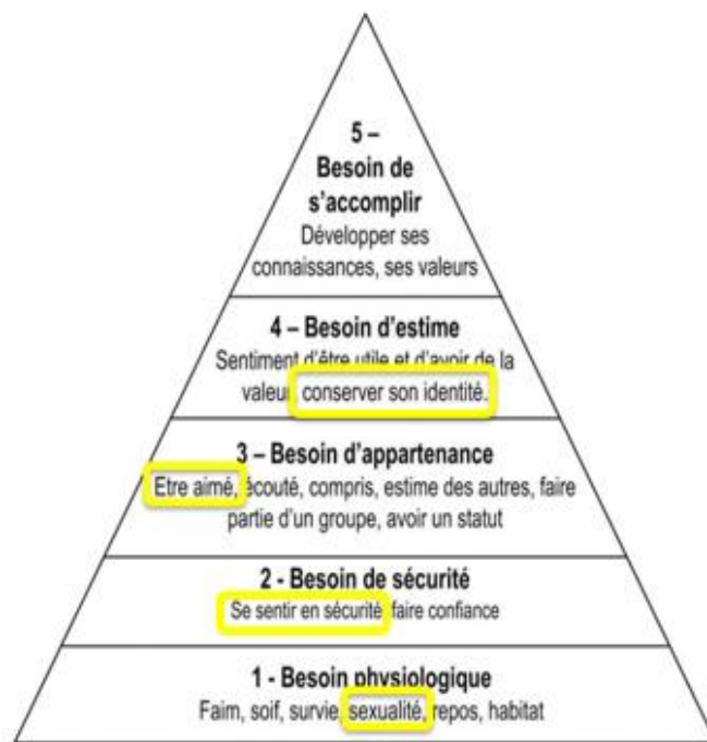
La hiérarchie des besoins selon la pyramide de Maslow

Les personnes hébergées ont également le droit à la vie privée et que celle-ci soit respectée, ce qui implique aussi le droit de demander de ne pas être dérangées dans leur chambre. Les prestataires de services doivent frapper à la porte et attendre d'être invités avant d'entrer dans une chambre.