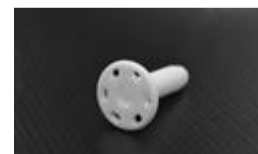
Smit sleeve 1

Lorsqu'on vous amènera au bloc opératoire, votre accompagnateur pourra se rendre dans la salle d'attente numéro 4 en radio-oncologie, au sous-sol (SS). Nous irons le chercher lorsque vous serez de retour de la salle de réveil.